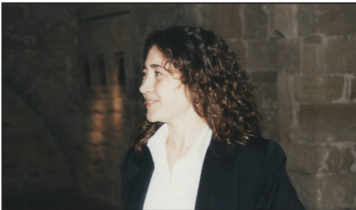
Col·lecció d'imatges de l'Arxiu Comarcal del Baix Empordà 1999

a una millor planificació de recursos i a una resposta més ajustada a les necessitats emergents del territori