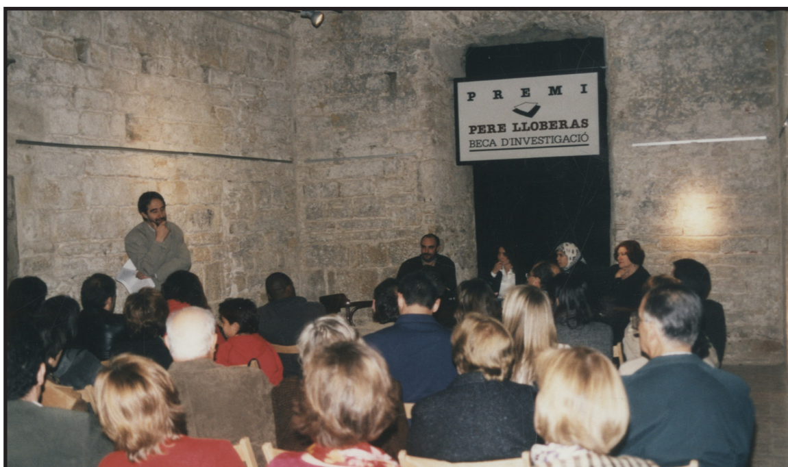
Col·lecció d'imatges de l'Arxiu Comarcal del Baix Empordà 1999