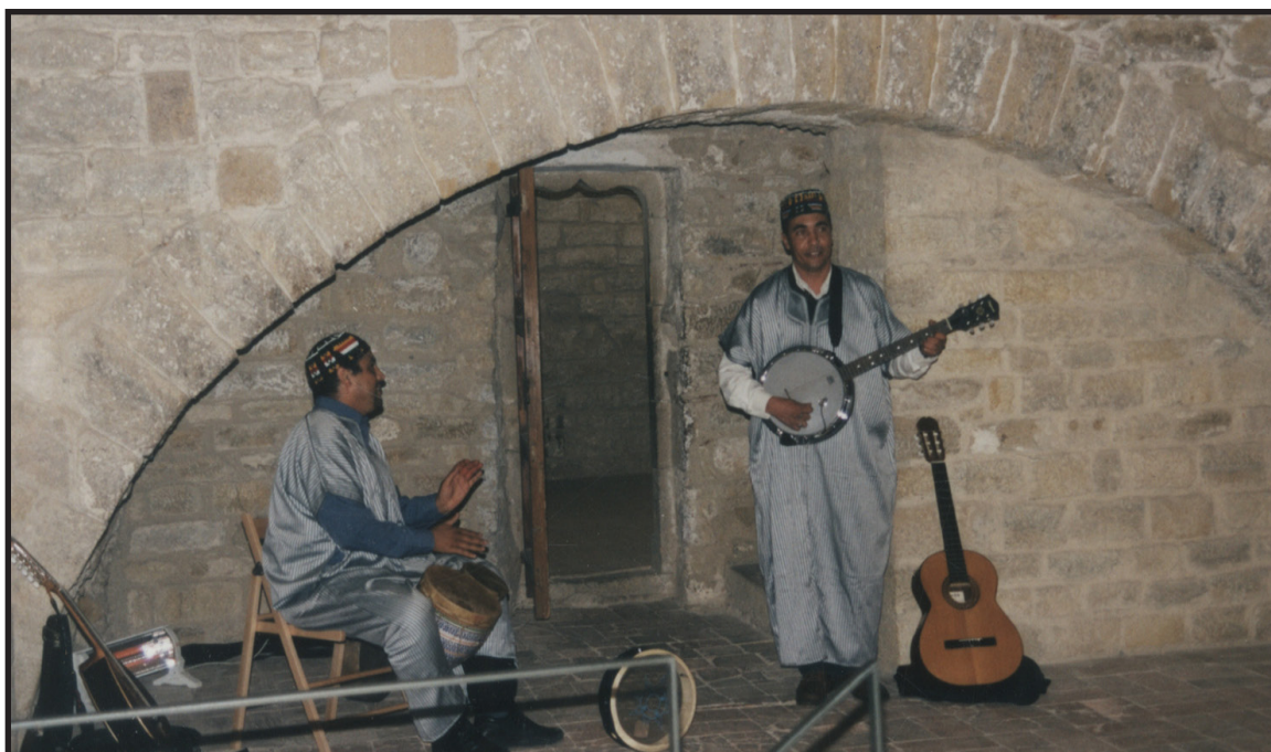
Col·lecció d'imatges de l'Arxiu Comarcal del Baix Empordà 1999