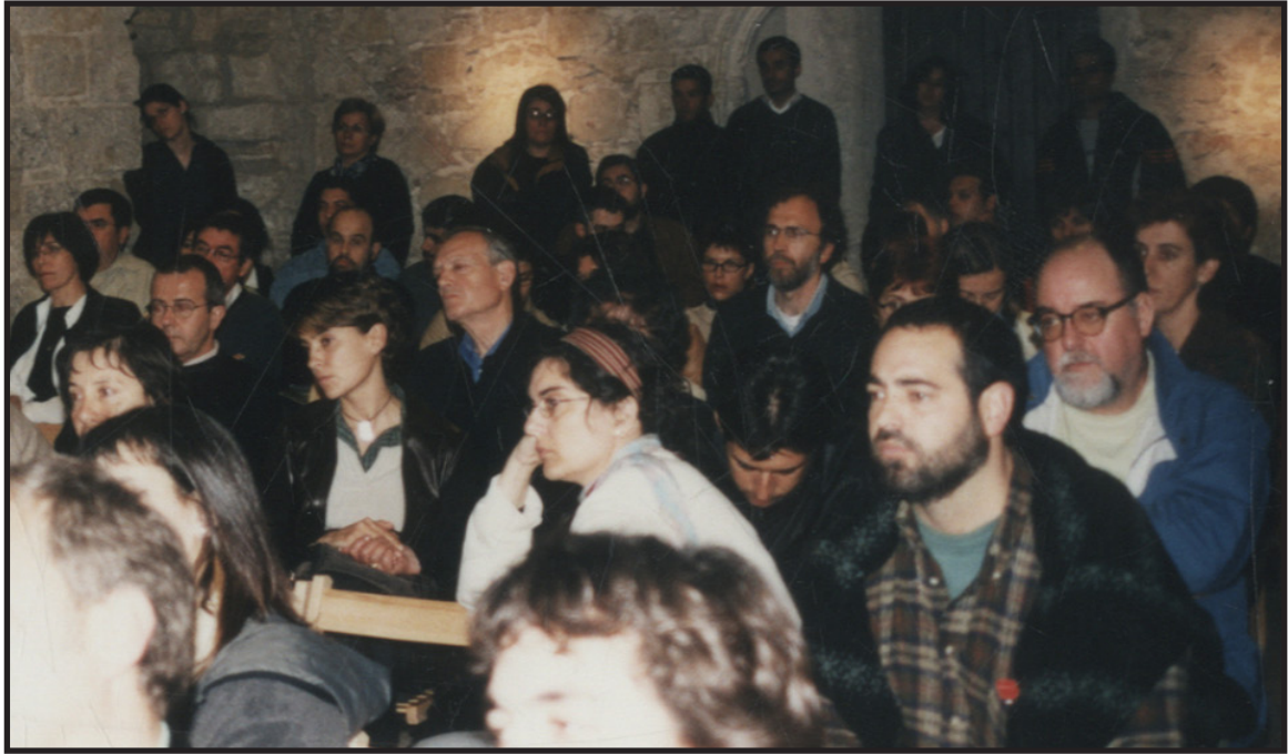
Col·lecció d'imatges de l'Arxiu Comarcal del Baix Empordà 1999