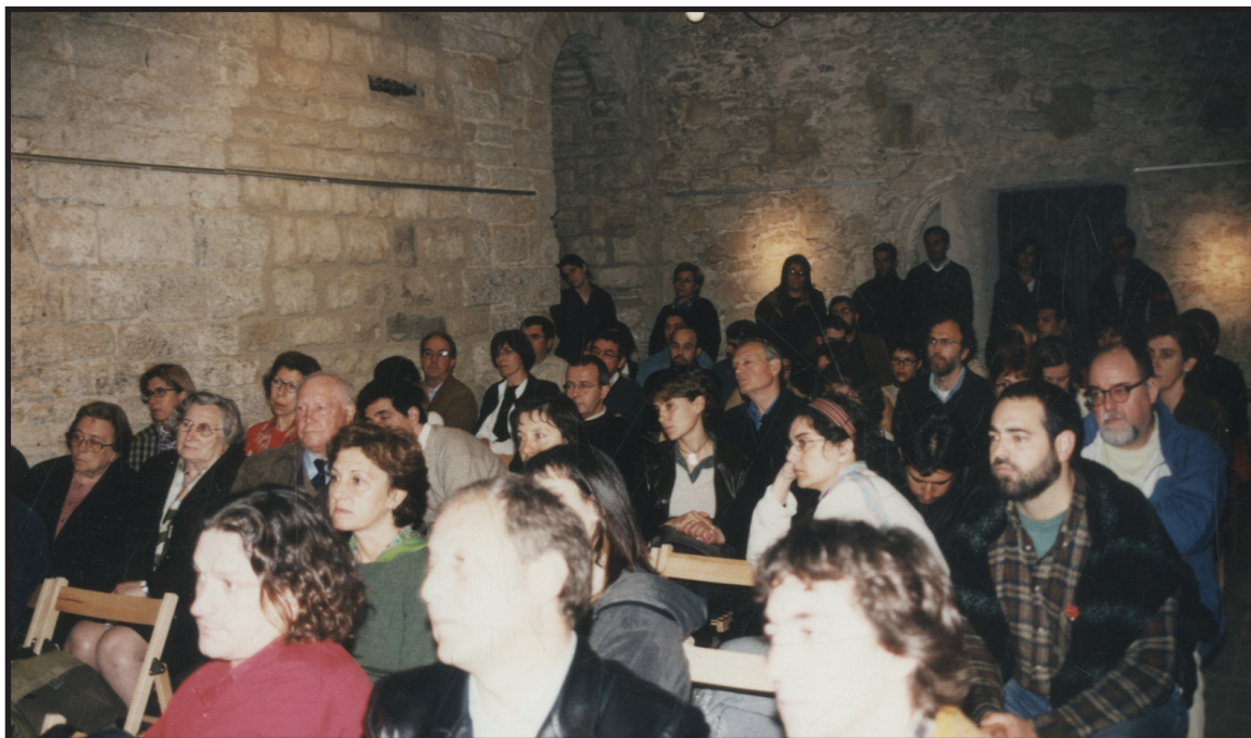
Col·lecció d'imatges de l'Arxiu Comarcal del Baix Empordà 1999