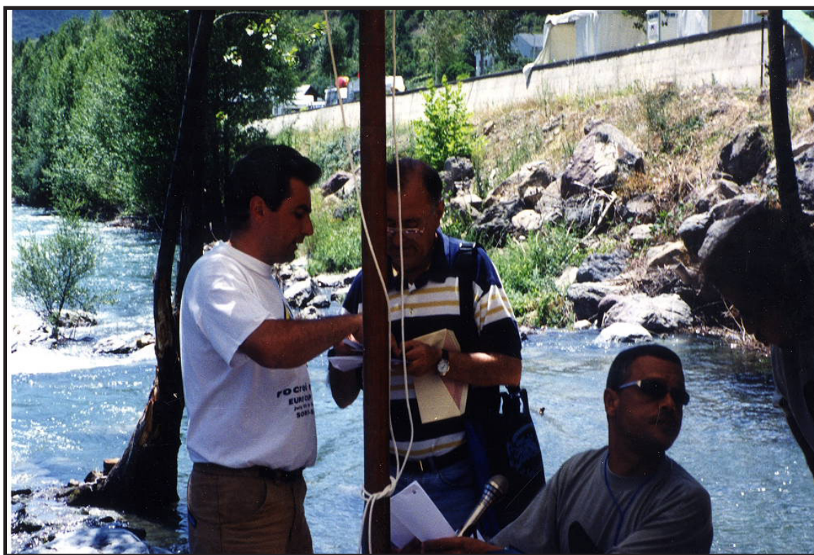
Col·lecció d'imatges de l'Arxiu Comarcal del Pallars Sobirà 2000

Finalment, aquest informe es presenta com un instrument de síntesi, anàlisi i rendició de comptes, amb la voluntat de documentar el conjunt del procés desenvolupat i de posar a disposició dels agents interessats la informació rellevant derivada de l'experiència. Així mateix, es configura com una base de coneixement útil per a la definició, planificació i execució de futures iniciatives de característiques similars, contribuint així a la millora contínua i a la consolidació de bones pràctiques en el sector.