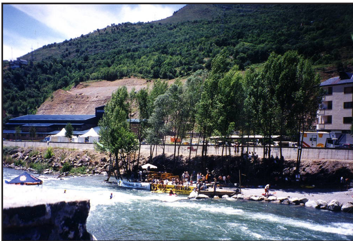
Col·lecció d'imatges de l'Arxiu Comarcal del Pallars Sobirà 2000

Així mateix, s'ha incorporat una lògica de millora contínua, basada en la recollida sistemàtica de dades, la valoració dels resultats i la identificació d'aprenentatges transferibles a futures iniciatives. Aquest enfocament metodològic ha contribuït a reforçar la qualitat del projecte i a consolidar un model d'intervenció replicable en altres contextos similars.