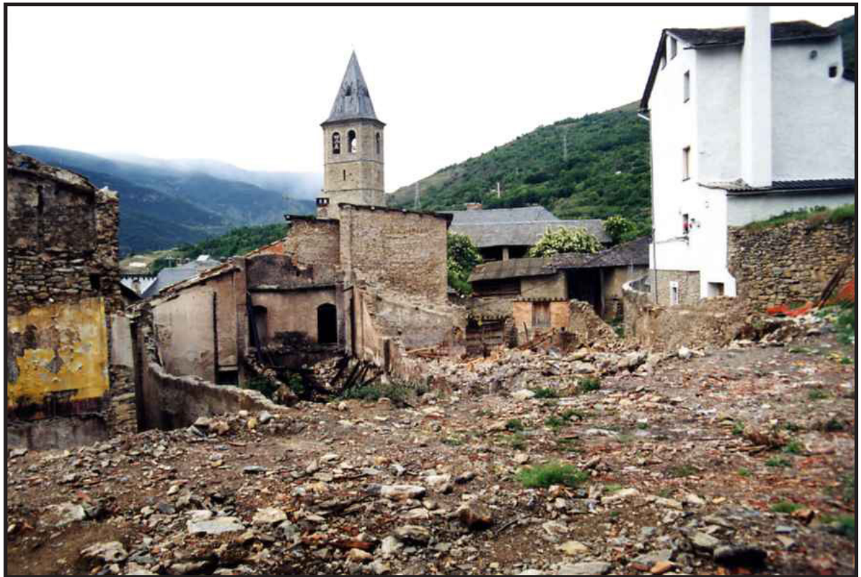
Arxiu Comarcal del Pallars Sobirà 1997

actuacions similars en entorns urbans de característiques comparables, procedint-se finalment a l'adjudicació de les obres a aquelles empreses que, d'acord amb els informes tècnics elaborats pels serveis municipals i pels òrgans de supervisió corresponents, reunien les millors condicions tant des del punt de vista econòmic com des del punt de vista tècnic.