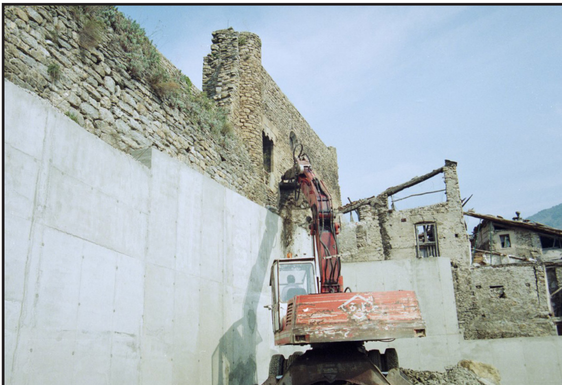
Arxiu Comarcal del Pallars Sobirà 1997