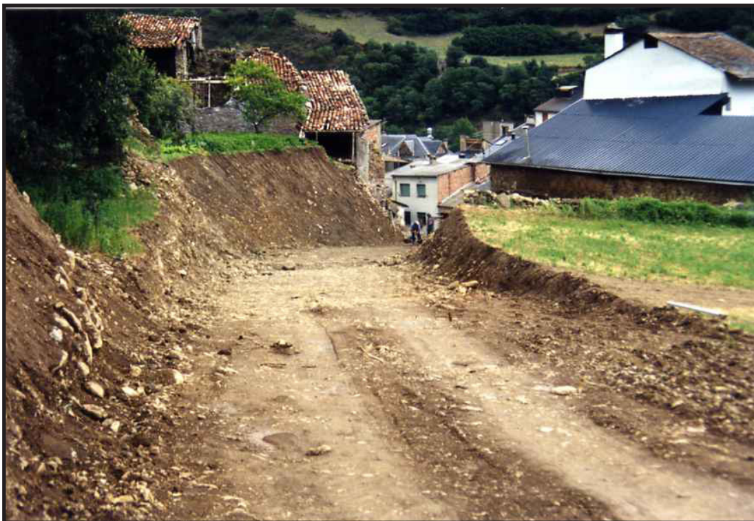
Arxiu Comarcal del Pallars Sobirà 1997

Aquestes modificacions han estat degudament justificades mitjançant els corresponents informes tècnics i aprovades pels òrgans administratius competents sense que en cap cas hagin suposat alteracions significatives dels objectius generals del projecte ni increments substancials del pressupost inicialment previst.