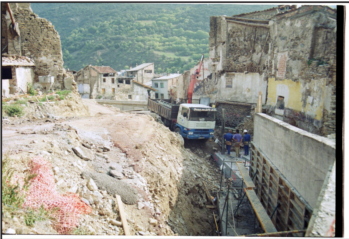
Arxiu Comarcal del Pallars Sobirà 1997

En relació amb aquests objectius cal indicar que la intervenció s'ha plantejat tenint en compte la necessitat de compatibilitzar la modernització de determinats serveis urbans amb el manteniment de les característiques morfològiques pròpies dels carrers del nucli antic, motiu pel qual els projectes tècnics han incorporat criteris d'integració paisatgística i utilització de materials tradicionals en aquelles zones on es considerava convenient preservar l'aspecte històric dels espais urbans afectats per les obres.