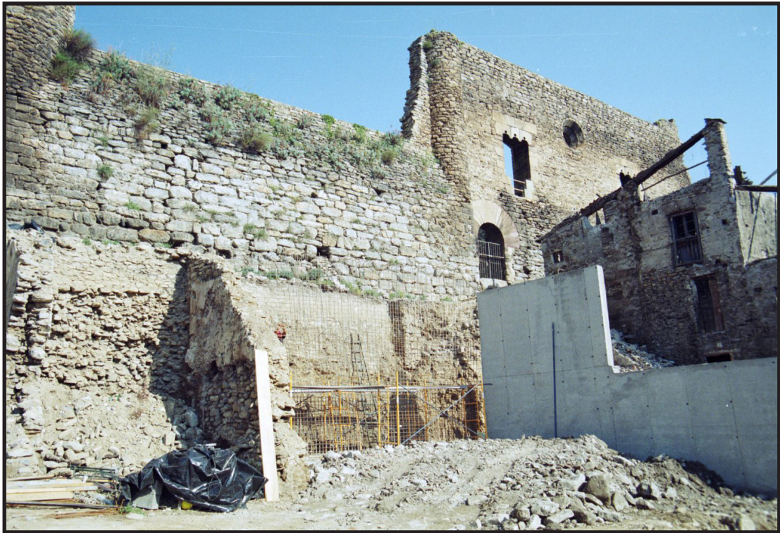
Arxiu Comarcal del Pallars Sobirà 1997