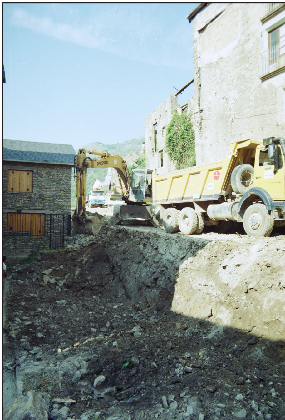
Arxiu Comarcal del Pallars Sobirà 1997

documentació pot ser requerida en el marc de procediments de verificació o auditoria posterior.