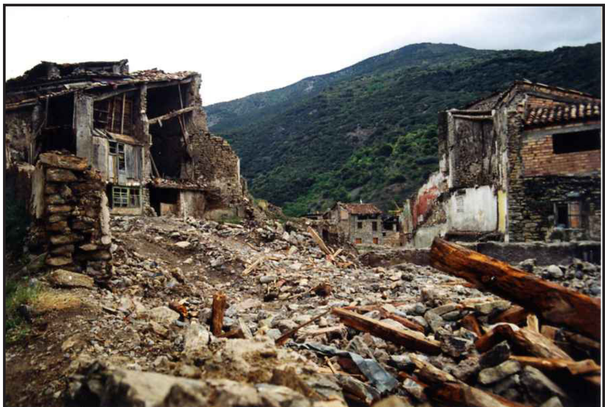
Arxiu Comarcal del Pallars Sobirà 1997

De la mateixa manera s'han elaborat diversos informes de seguiment en els quals es recullen les principals incidències detectades durant el desenvolupament de les obres així com les mesures adoptades per tal de corregir aquelles situacions que requerien una intervenció tècnica específica, informes que han estat incorporats als expedients administratius corresponents com a part de la documentació justificativa del projecte.