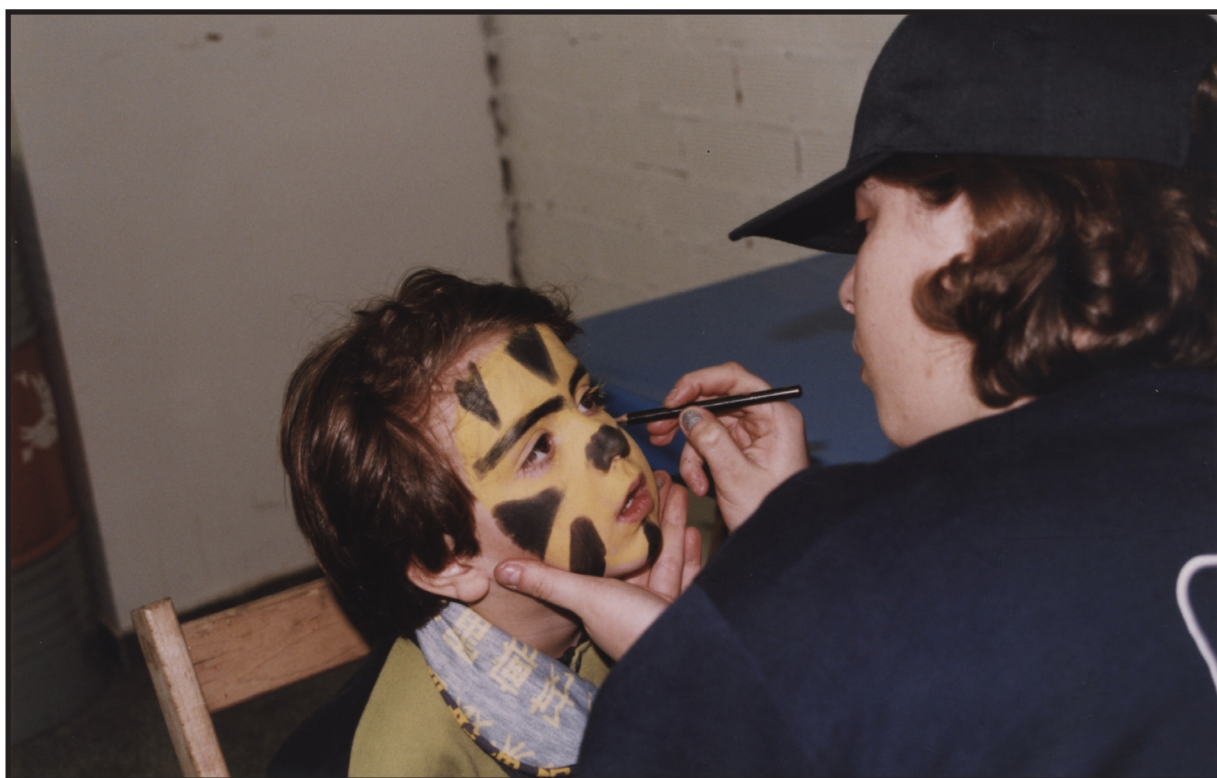
Col·lecció d'imatges de l'Arxiu de l'Anoia 1999

Finalment, es preveu avançar cap a la integració progressiva del Saló de la Infància dins d'una estratègia comarcal més àmplia en matèria de polítiques d'infància i lleure educatiu, de manera que aquesta iniciativa no es concebi únicament com un esdeveniment puntual, sinó com un element estructural dins del conjunt d'actuacions orientades a millorar el benestar i el desenvolupament integral de la població infantil de la comarca de l'Anoia.