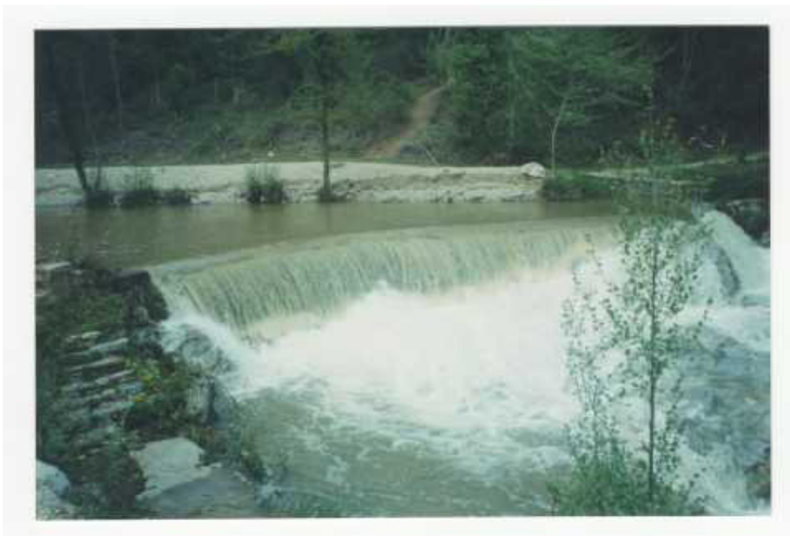
Col·lecció d'imatges de l'Arxiu Comarcal de l'Alt Empordà 1990

En particular, es van identificar oportunitats relacionades amb el desenvolupament del turisme rural, la valorització de productes agroalimentaris de proximitat, la recuperació d'activitats artesanals tradicionals i la rehabilitació del patrimoni arquitectònic com a recurs per a nous usos residencials o econòmics.