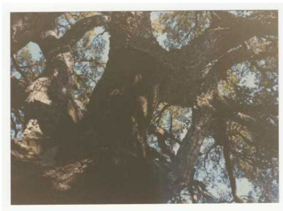
Col·lecció d'imatges de l'Arxiu Comarcal de l'Alt Empordà 1990

Els resultats obtinguts suggereixen que l'aplicació d'estratègies integrades de desenvolupament local pot contribuir de manera efectiva a afrontar els reptes estructurals dels territoris rurals de muntanya.