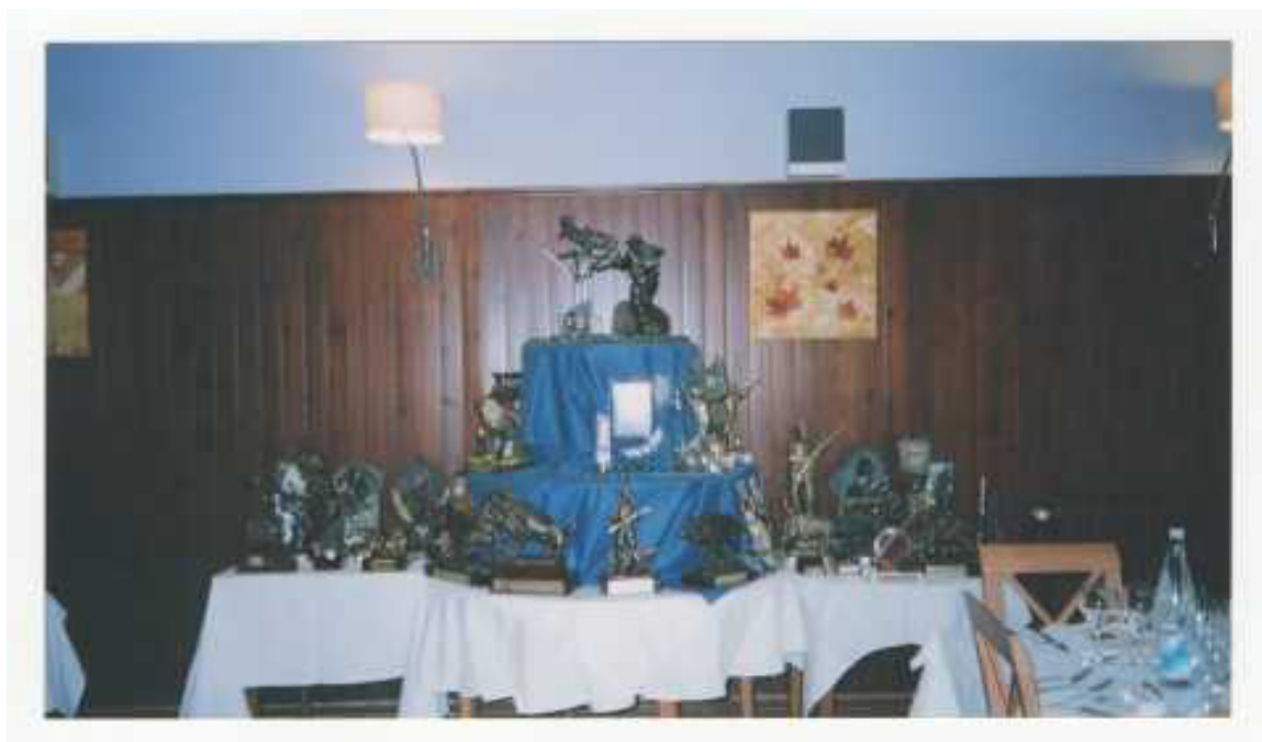
Col·lecció d'imatges de l'Arxiu Comarcal de l'Alt Empordà 1990

Durant aquesta etapa es van establir mecanismes de seguiment periòdic que van permetre monitoritzar l'evolució del projecte, identificar possibles incidències i introduir ajustos operatius quan ha estat necessari.